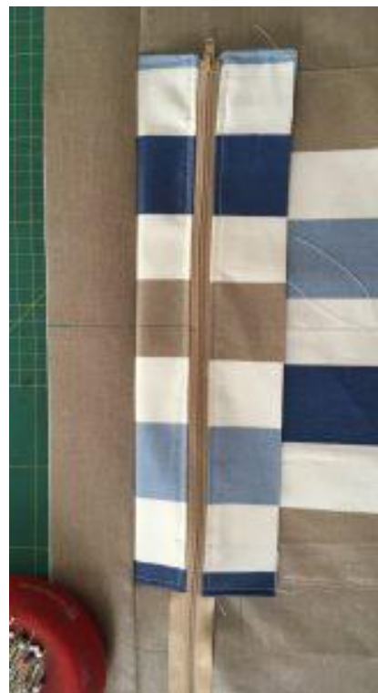
La partie zippée assemblée à la doublure et à la bande thermocollée.