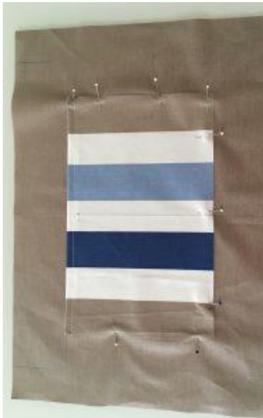
Pose de la poche sur l'une des doublures.

Assemblage du zip à la doublure. Prendre en sandwich le zip entre la doublure et les bandes thermocollées.