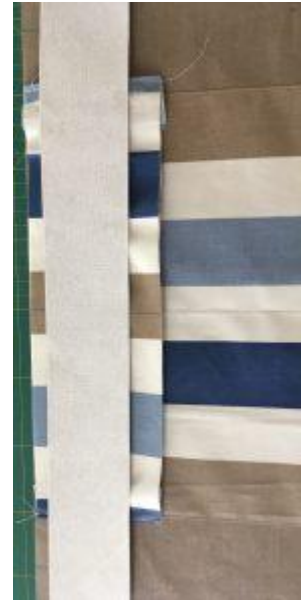
Poser la bande thermocollée sur l'ensemble du zip.