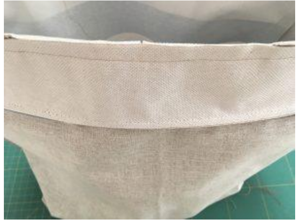
Les 2 sacs sont assemblés.

Retournement des sacs sur l'endroit. Pour ne pas abîmer le sac principal, retourner la doublure par la grande ouverture du fond « en déshabillant » le sac principal de sa doublure.