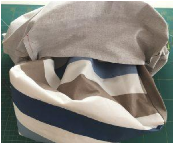
Tirer la doublure par le fond jusqu'à la libération du sac principal. Retourner la doublure à l'endroit.

Retournement des sacs sur l'endroit. Pour ne pas abîmer le sac principal, retourner la doublure par la grande ouverture du fond « en déshabillant » le sac principal de sa doublure.