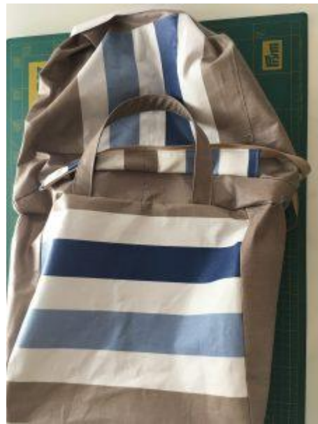
Retournement du sac et doublure à l'endroit. La doublure est tirée vers le haut du sac principal.

Refermer le fond de la doublure avec un point droit au plus près du bord. Rentrer ensuite la doublure à l'intérieur du sac principal.