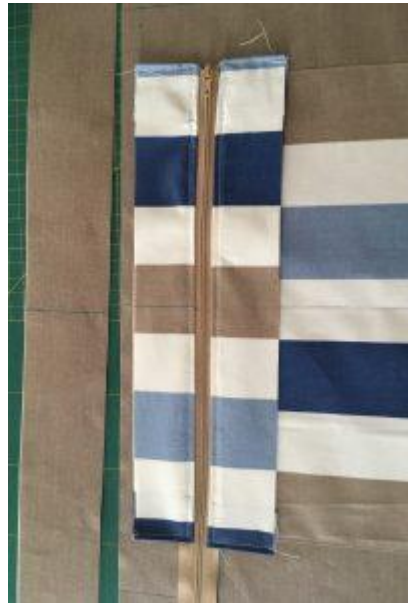
Positionner la partie zip sur l'endroit de la doublure en haut au centre. Le curseur se trouve sur l'endroit.