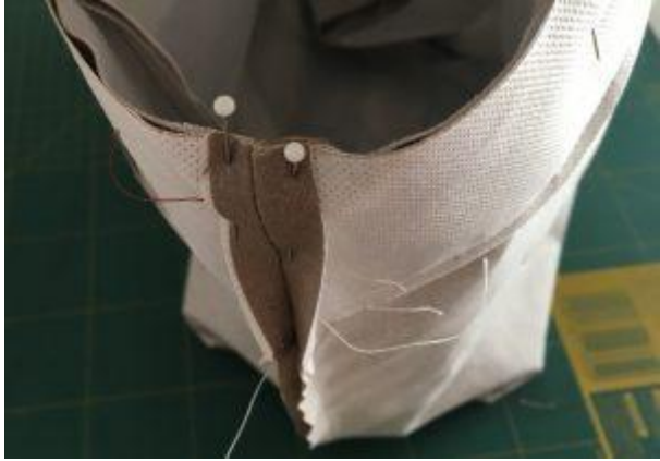
Gros plan des 2 sacs épinglés. Couture ouverte.