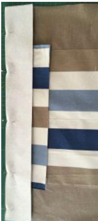
Epingler la bande thermocollée sur l'ensemble zippé et la doublure.